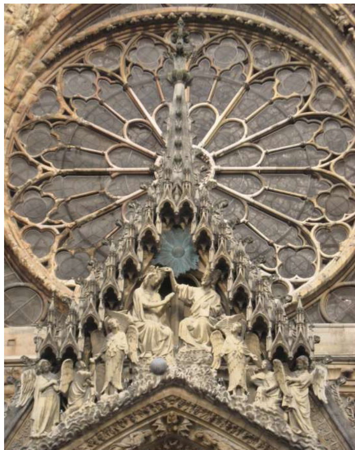
Сл. 8. Крунисање Богородице, Ремс