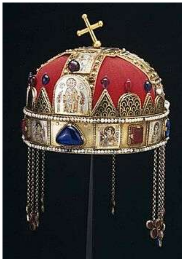
Сл. 4б. Круна Светог Стефана