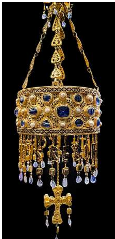
Сл. 4а. Визиготска круна, Музеј Клини