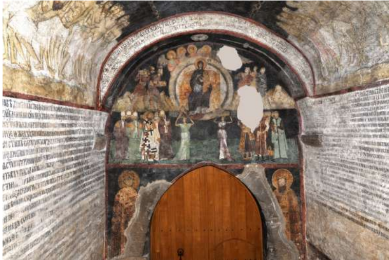
Сл. 3 и сл. 3а. Жича, повеље исписане на зиду улазне куле у манастир

Јеванђеља и повеље су имале карактер „проскинитос-а“, односно, предмета пред којим се присутни клањају. О посебном карактеру и намени уводних текстова свечаних даровница сведочи и околност да су повеље понекад исписиване и на зидовима храмова, добијајући на тај начин нову, апотропејску функцију. Речити примери, преузети из Византије, забележени су и у српском наслеђу. Потребно је нагласити да је у наведеним случајевима реч о владарским даровницама: представљање монарха на свечаним портретима како држе свитке са повељама носило је додатне импликације, симболишући акт даривања цркава и манастира као владарев пут ка спасењу.