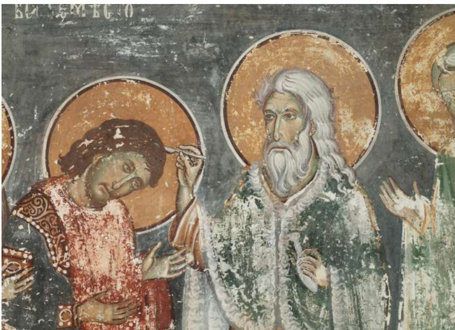
Сл. 7. Миропомазање, Морача (детал)