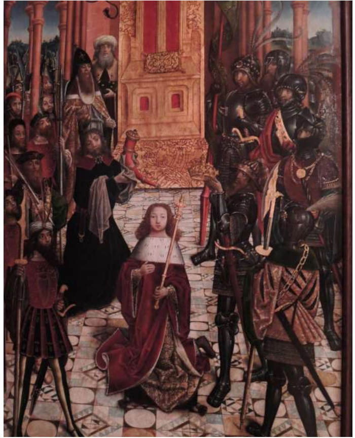
Сл. 7б. Миропомазање