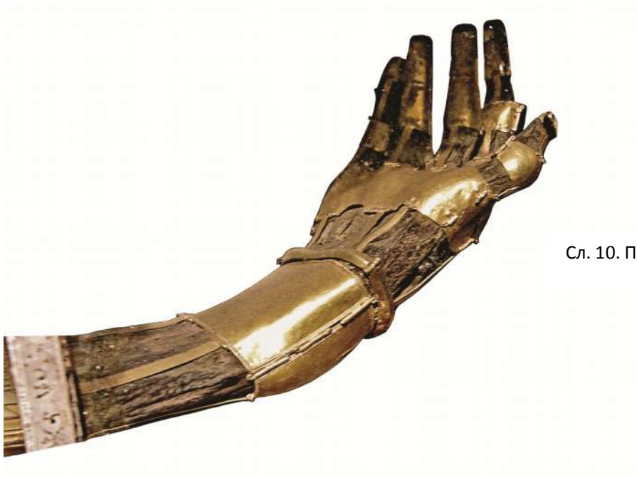
Сл. 10. Претечина десница

инсигнијама власти, као и различите врсте благослова. Прецизно су дефинисани покрети које чини сам владар као и првосвештеник који обред обавља. Обиље сачуваног изворног материјала на европском западу, као и у Византији, олакшало је научни увид како у пажњу која је придавана ритуалним гестовима тако и потребу тадашњих друштава да их прецизно одреде.