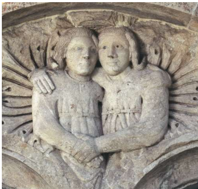
Сл. 1. Брачни пар, скулптура из Дечана

Поред значења које је amicitia имала на пољу политичких веза, она је и кључан фактор у одређивању друштвеног идентитета појединца. Управо стога, ове односе, који се по правилу исказују гестом, прати и сасвим одређена реторика афективних формула, изнијансирани речник који срећемо у преписци учених, углавном клирика. Њу одликује наглашено емотивна боја карактеристична за односе унутар породице. Важан жанр који помаже јаснијој слици о односима пријатељства карактеристичним за клерикалну елиту, представља епистографија . Када је реч о српској књижевности, сачуван је мали број приватних писама. Оно што је преостало, попут епистолија кир Силуанових, Савине Посланице Спиридону или књижевних посланица забележених у Горичком зборнику, да не наводимо иоле комплетнији списак сведочанстава међу којима би се на сваки начин морала наћи и писма забележена унутар хагиографских састава (код Доментијана, Теодосија и посебно, код Данила), пружа нам непотпуну али карактеристичну слику о епистографском наслеђу српског средњег века.