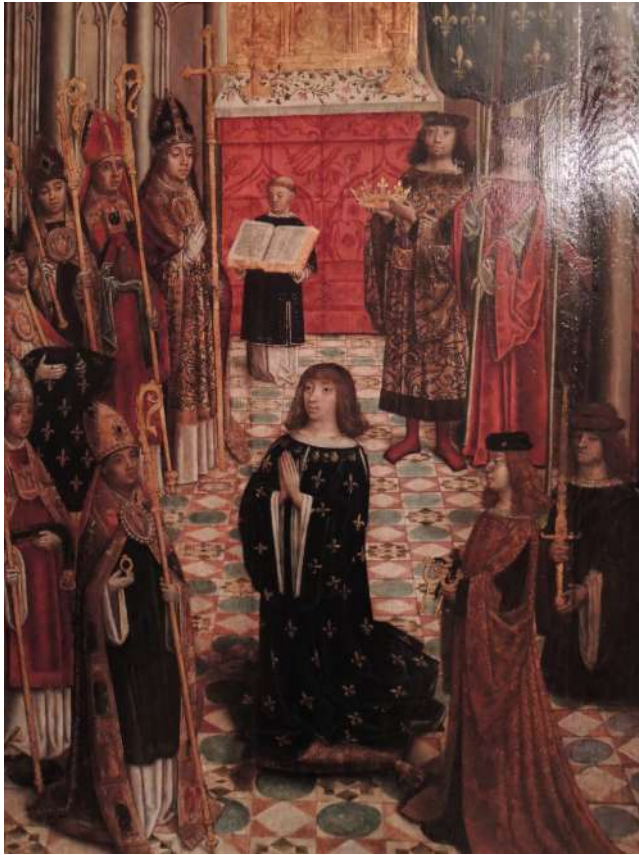
Сл. 9. Sacre француских краљева

Посебан карактер политичког ритуала имао је царски (краљевски) свечани улазак у град или манастир. Објашњења природе и начина функционисања ове церемоније у средњовековном друштву приближава нас разумевању његове политичке културе. Фазе адвента добро су познате и проучене у медијевистици. Дуго трајање овог обичаја може се објаснити међусобним преплитањем два ритуала: с једне стране, реч је о понављању, те сталном обнављању у оквиру годишњег циклуса успомене на Христов улазак у Јерусалим током празника Цвети, а са друге, о реалности свечаних дочека владара и других достојанственика или реликвија у градску/манастирску заједницу, које су обележаване посебним ритуализованим процесијама ( occursus ). Управо претапање ових догађаја у јединствени амалгам који је представљала литургијска процесија поводом свечаних дочека, допринело је кодификацији ових ритуала у оквирима ordines , установљеним у релативно фиксираном облику током 10. века, као и састављањем посебних химни које су певане током процесија. По правилу, све ове ритуале пратили су за њих састављани књижевни текстови; резултат наративних интерпретација, они представљају мање или више субјективне описе из којих историчари настоје да ишчитају природу ових церемонија, као и политичке поруке које се крију иза субјективности самих тих текстова.