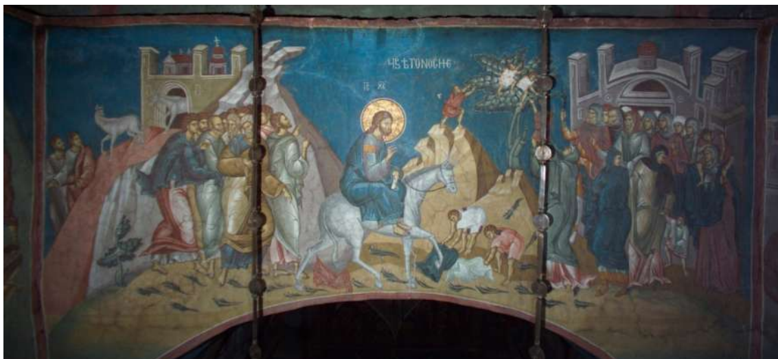
Сл. 5. Цвети, Дечани