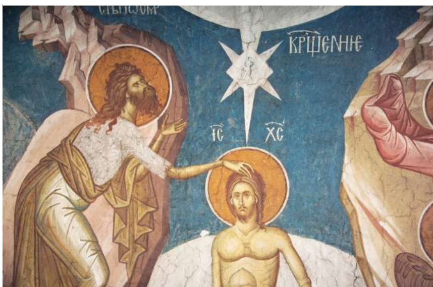
Сл. 6. Крштење, Дечани