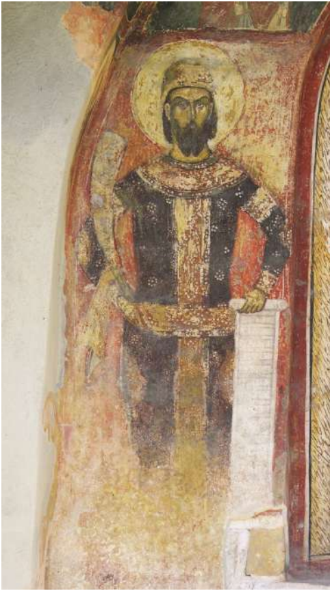
Сл. 7а. Краљ Марко са рогом миропомазања, Марков манастир