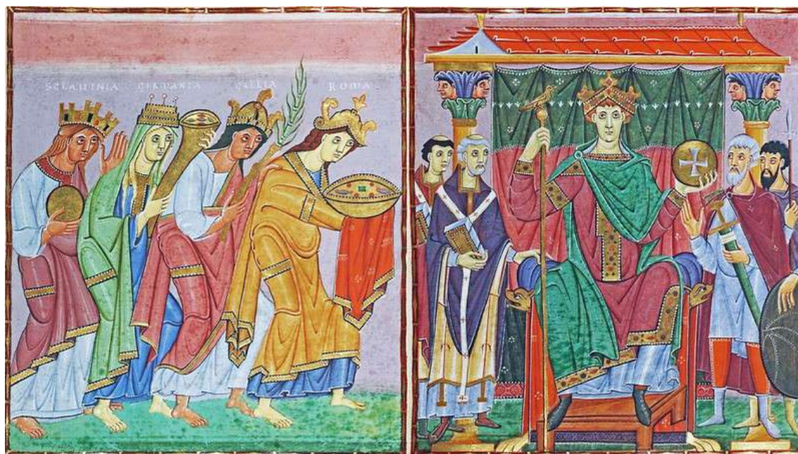
Сл. 4в. Отон III и персонификације царских провинција