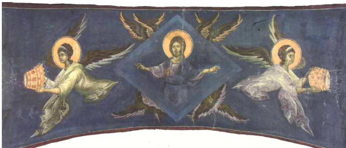
Сл. 4. Крунисање из Грачанице

Различити ритуали – од обреда крштења и крунисања владара, посебних обреда везаних за прилике у којима је било одређено да носе круне ( Festkrönungen ) или друге инсигније власти, увођења у звање унутар прецизно одређене друштвене хијерархије ( commendatio ), различитих ритуалних процесија, литургијских прослава великих хришћанских празника, парада и свечаности, укључујући јавна суђења, витешке игре, банкете, полагања заклетви, свечане пријеме са проскинезом, акламације и laudes , преко сахрањивања, до свечаног адвентуса владара или високих достојанственика у град или манастир и преноса светитељских моштију – представљају кохезивни фактор унутар заједнице, учвршћују њен идентитет и њено сакрално устројство. Поред обреда који се одвијају унутар цркве и имају јасан литургијски карактер, посебну групу чине искључиво профани ритуали попут светковина као што су лов или пир који су били обавезни завршни део одређених церемонија.