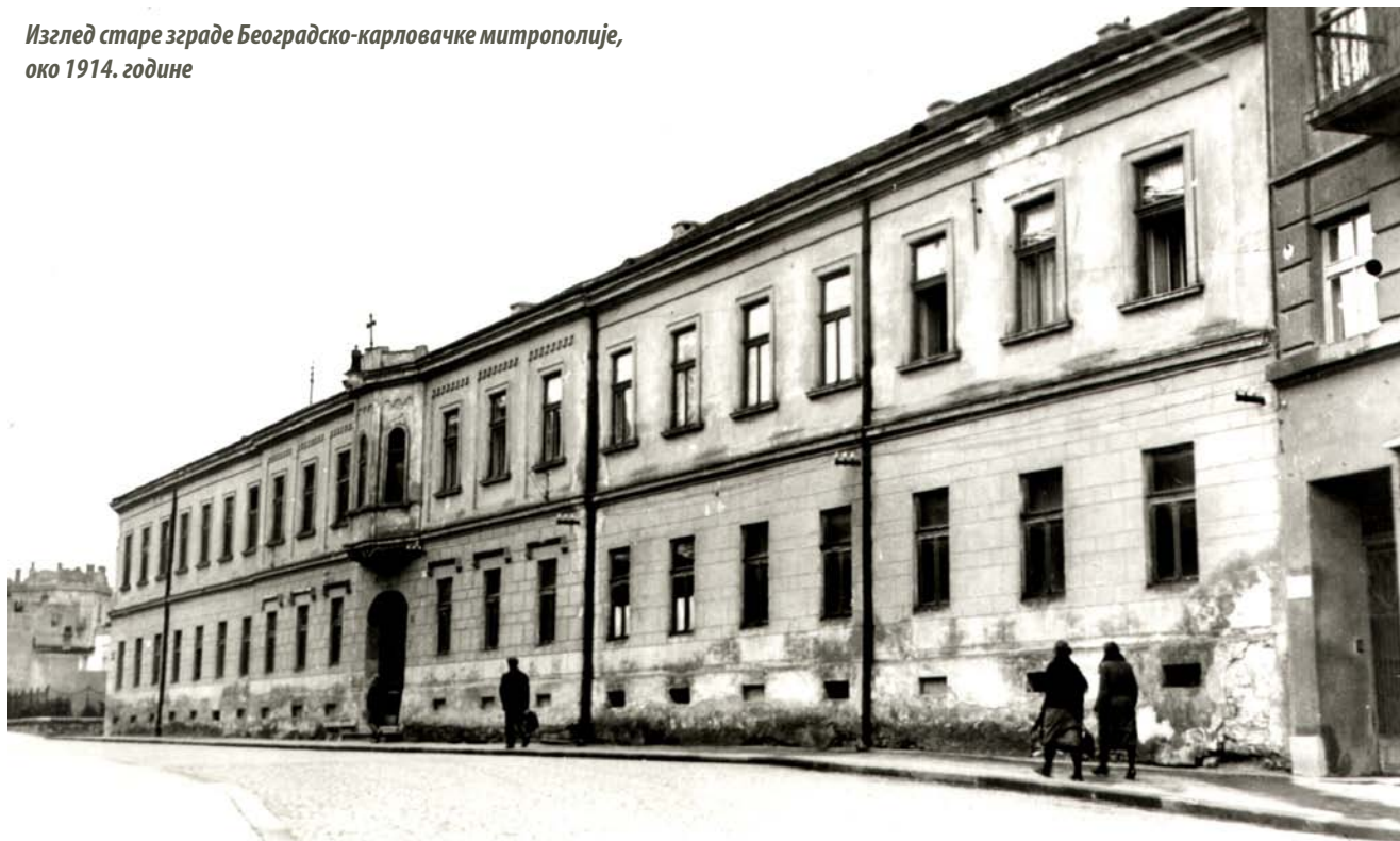
Изглед старе зграде Београдско-карловачке митрополије, око 1914. године

Саборне цркве, током времена подизана су многа друга значајна здања као Конак кнегиње Љубице, Митрополија београдско-карловачка, Државна штампарија, Народна канцеларија и магистрат, Народна библиотека и др. Осим набројаних јавних и приватних здања значајних за историју Србије, очуван је и добар део оригиналне урбанистичке структуре простора Косанчићевог венца, као и неколико изванредних архитектонских остварења, тако да овај део града представља специфичан амбијент који у великој мери презентује историјски изглед старог Београда. Реч је дакле о слојевитом простору, изразитих архитектонских, урбанистичких и историјских вредности, који је једно од најзначајнијих материјалних сведочанстава српске историје у